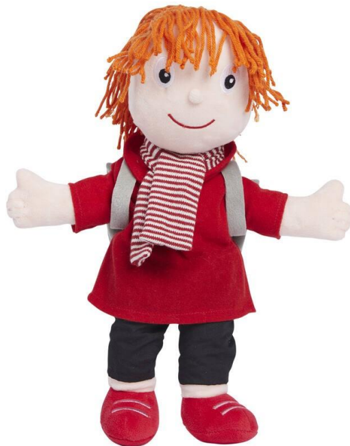
Pippa uit Piramide

Kinderen ontwikkelen zich op verschillende manieren. Er worden activiteiten aan de hele groep aangeboden in de kring en daarnaast zijn er activiteiten die we in kleine groepjes of individueel aanbieden.